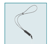
Leather Strap O-ST24