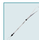
Sport Strap O-ST30